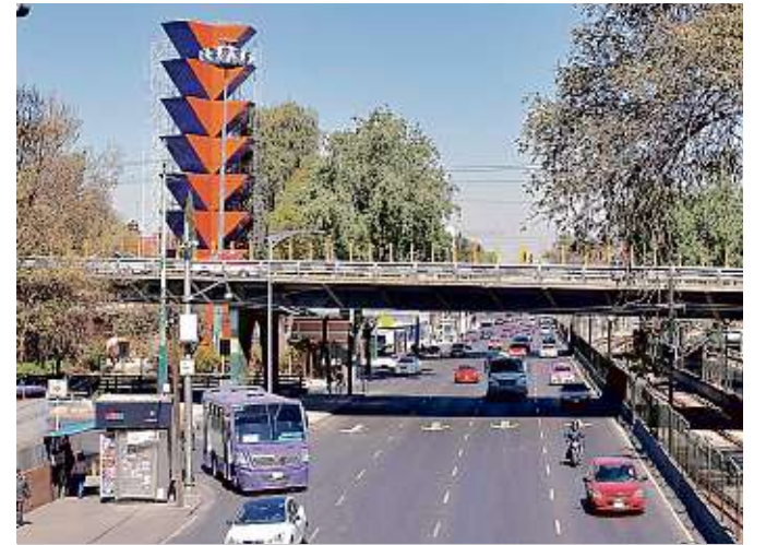
La Gran Espiga, obra del artista en Taxqueña y Tlalpan.

Deberían, opinó, recopilarse tanto sus creaciones como sus escritos.