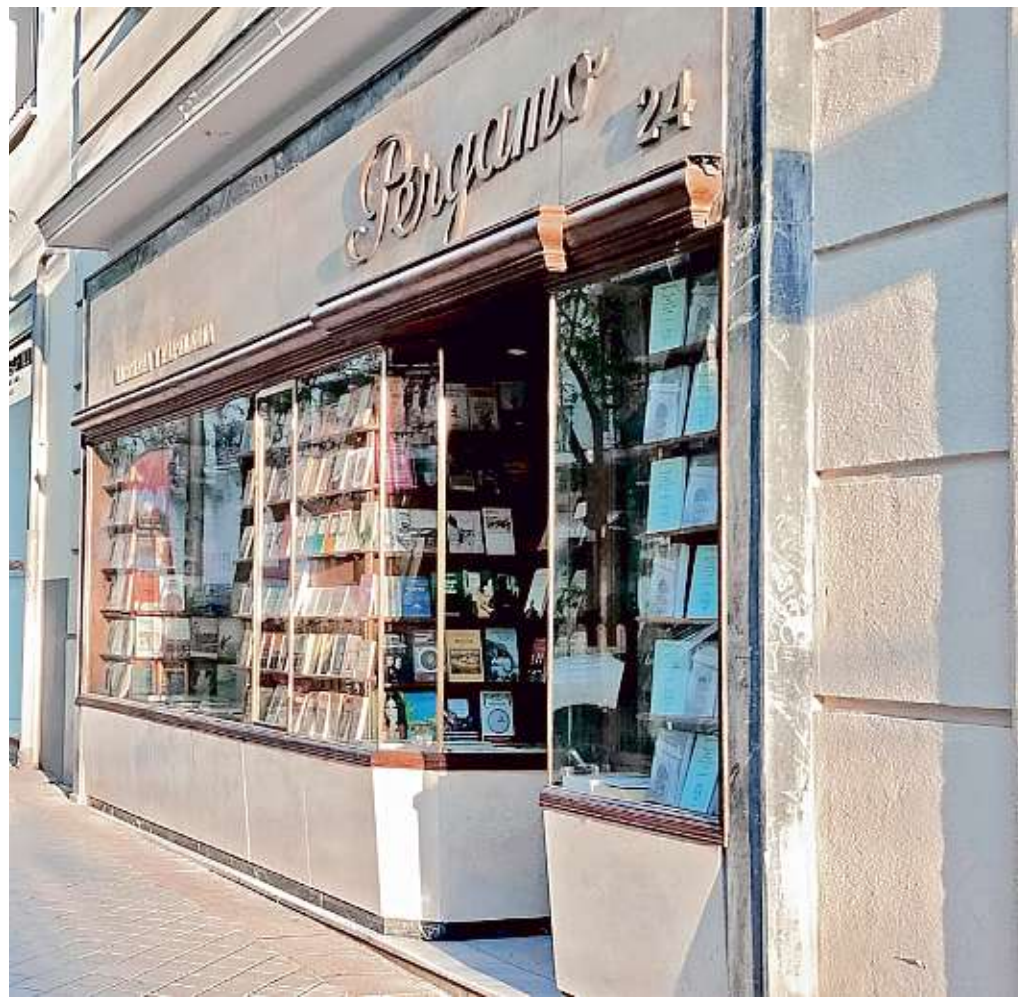
■ La legendaria librería Pérgamo, con más de 70 años de historia, se ubica en la General Oráa 24, en el barrio madrileño de Salamanca; había cerrado sus puertas el año pasado tras la pandemia.