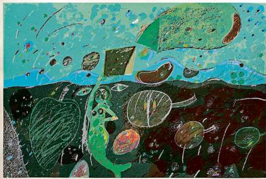
Medio centenar de obras conformarán la expo que alista el Munae, prevista para agosto.