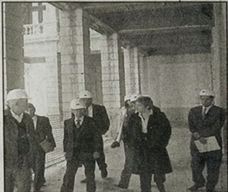
EN la visita hecha al histórico inmueble, en donde se localiza el calabozo de don Miguel Hidalgo, fue presentado a los integrantes del organismo un avance de los trabajos de remodelación.

Se informó a los presentes sobre las labores efectuadas para el remozamiento general de la cantera, trabajos de carpintería, retiro de muros interiores, de duelas de madera, de impermeabilizantes en el techo, bastidores de